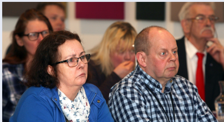
Frá aðalfundinum á laugardag.