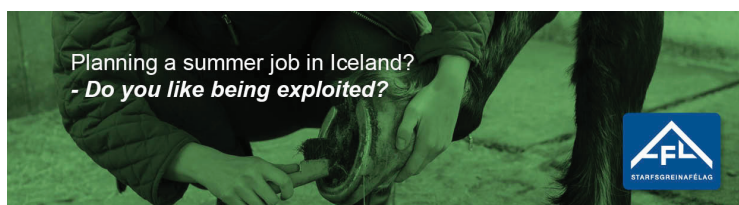
Auglýsingaberferðir AFLs um þessar mundir.